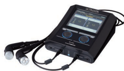
◎超音波・超音波骨折治療器