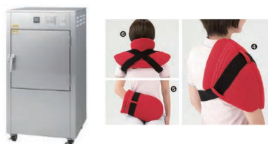
◎乾式ホットパック・ソリッドパック