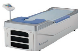
◎ウォーターベッド