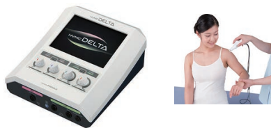
◎小型ハイボルト・MC 治療器